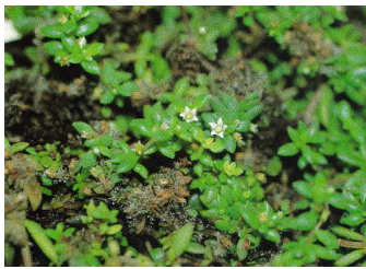
Fig. 3 – Crassula humbertii Descoings : feuilles à limbe ponctué de taches pourpres ; fleur blanche.

Espèce la plus fréquente, récoltée plusieurs fois aux environs de Fianarantsoa, entre 800 et 1500 m. : Allorge 744, vers Andasibe ; Rakoto, R. & Turk, D. 200, PN de Ranomafana ; Rakotozafy, A. & Andriananantena, D. 282, PN de Ranomafana ; Rakotovao, C. & al. 124, Andringitra, 720 m.