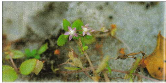
Fig. 1 - Crassula micans Vahl ex Baill.

Feuilles connées à la base – fleurs groupées ordinairement en cyme ..... C. cordifolia